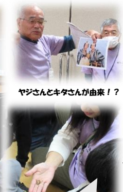
ヤジさんとキタさんが由来！？