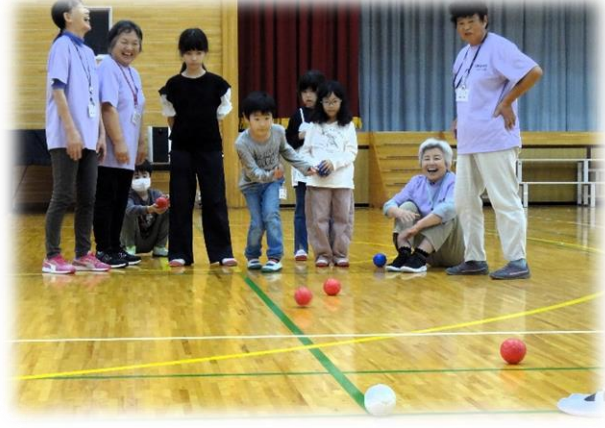
Aチームの1投目 ていねいに投げて

本日の放課後楽校は「ポッチャに親しもう」。スタッフによるポッチャの模擬試合から開始