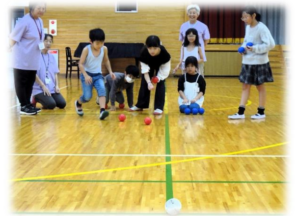
Aチーム3投目 ボールを寄せました