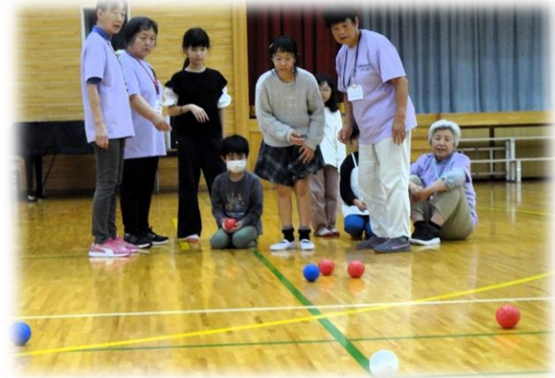
Bチームの3投目 いい投球です