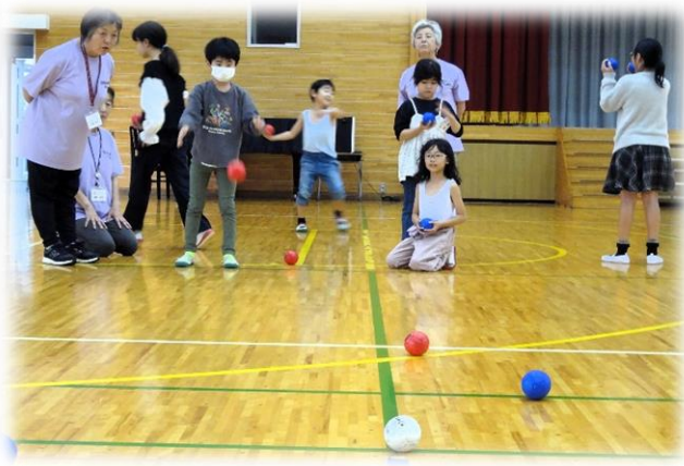
Aチームの2投目 斜めからねらっています