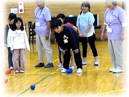
Cチームのみなさん 接戦が続き汗だくになってのプレーで 盛り上がっています