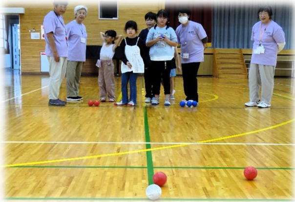
Bチームの2投目 集中力がすごい