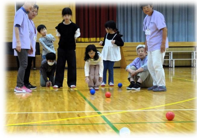
Bチームの1投目 真剣そのもの