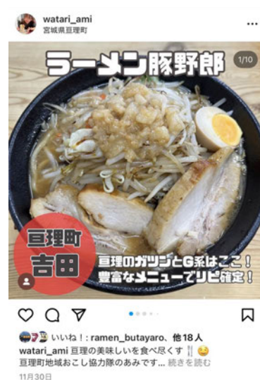
Instagram 11月30日投稿 ラーメン豚野郎さん