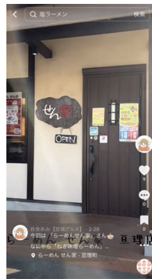
TikTok 2月28日投稿 らーめん せん家さん