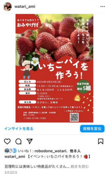
Instagram 3月22日投稿 イベント告知