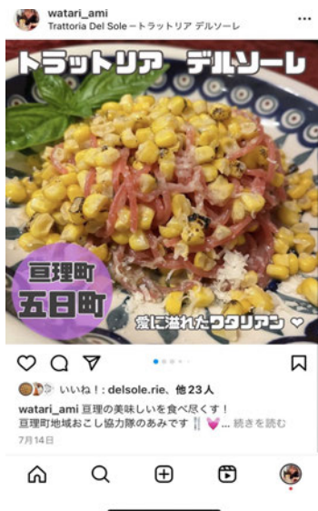
Instagram 7月14日投稿 トラットリア デルソーレさん