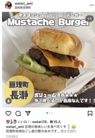
Instagram 11月29日投稿 Mustache Burgerさん