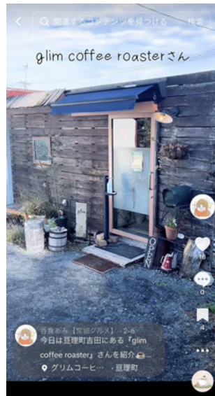
TikTok 2月6日投稿 glim coffee roasterさん