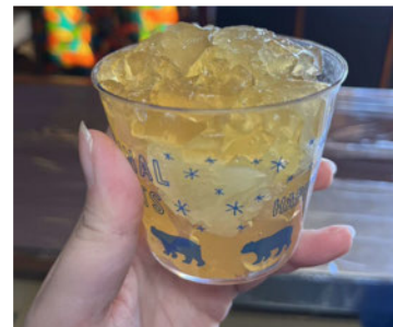
▲リンゴを砂糖漬けた液で作ったゼリー

店舗運営を始めることはできなかったが、今後店舗が始まった際の端材を使った商品なども試作し 準備することができたのでよかった。