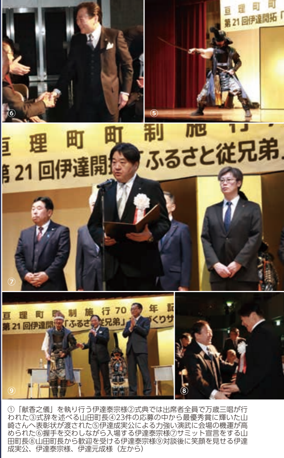
①「献香之儀」を執り行う伊達泰宗様②式典では出席者全員で万歳三唱が行われた③式辞を述べる山田町長④23件の応募の中から最優秀賞に輝いた山崎さんへ表彰状が渡された⑤伊達成実公による力強い演武に会場の機運が高められた⑥握手を交わしながら入場する伊達泰宗様⑦サミット宣言をする山田町長⑧山田町長から歓迎を受ける伊達泰宗様⑨対談後に笑顔を見せる伊達成実公、伊達泰宗様、伊達元成様（左から）