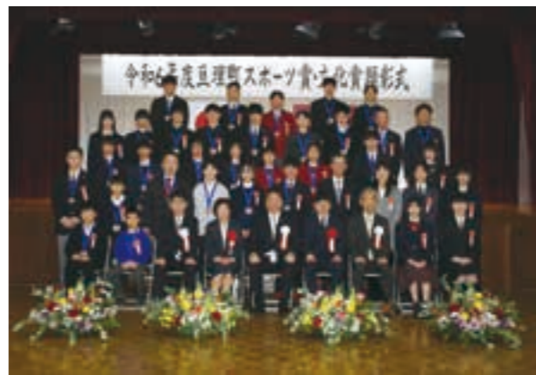
受賞者のみなさん