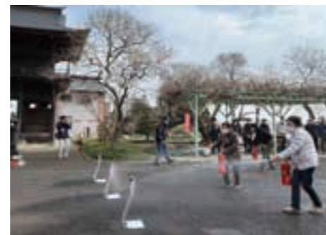
初期消火訓練を行う参加者たち

町の宝を火災から守るために 文化財防火訓練 1月23日、山門が町指定文化財となっている大雄寺で、文化財防火訓練と防火査察が行われました。 これは、1月26日の文化財防火デーにちなみ、町内の文化財を対象に毎年実施しているものです。 当日は、大雄寺の住職や地域住民、文化財保護委員などが参加し、巨理消防署の指導のもと、消火設備の点検や初期消火訓練などが行われました。 また、訓練とあわせて、郷土資料館の学芸員による大雄寺の歴史と文化財についての解説も行われ、参加者たちは、いざというときの行動を学ぶとともに、文化財の大切さを再確認していました。