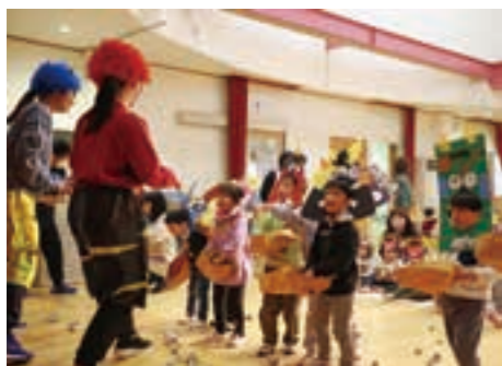
豆を投げて鬼を退治する園児たち

大きな声で鬼を退治！ 吉田保育所豆まき 2月3日、吉田保育所で恒例の節分行事「豆まき」が行われました。当日は、はじめに園児たちが、先生から節分の由来を学んだり、鬼が苦手とされる柊の葉や炙った鰯の匂いを体感したりしました。その後、園児たちは手作りした鬼のお面を身に付け、可愛らしい鬼に変身。お面づくりで工夫した点や、自分の中に潜んでいる退治したい鬼をそれぞれ発表しました。 いよいよ鬼が登場すると、園児たちは「鬼はそこ！福はうち！」という元気の良い掛け声とともに、災厄や疫病をもたらすとされる鬼に豆をまいていました。