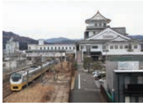
巨理駅を通過する特急ひたち