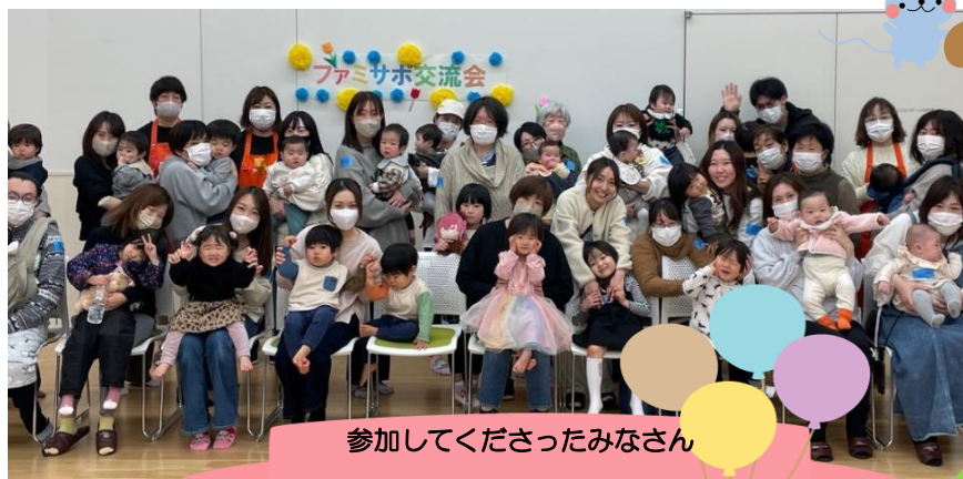
参加してくださったみなさん ありがとうございました☆